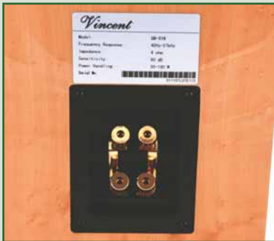
Qualche economia trapela dalla vaschetta in plastica.

sincero non gradisco molto tale tipo di finitura, soprattutto abbinata all'effetto laccato, in quanto la trovo un po' troppo carica per i miei gusti, ma immaginandole nella versione nero piano dovrebbero proprio essere molto eleganti.